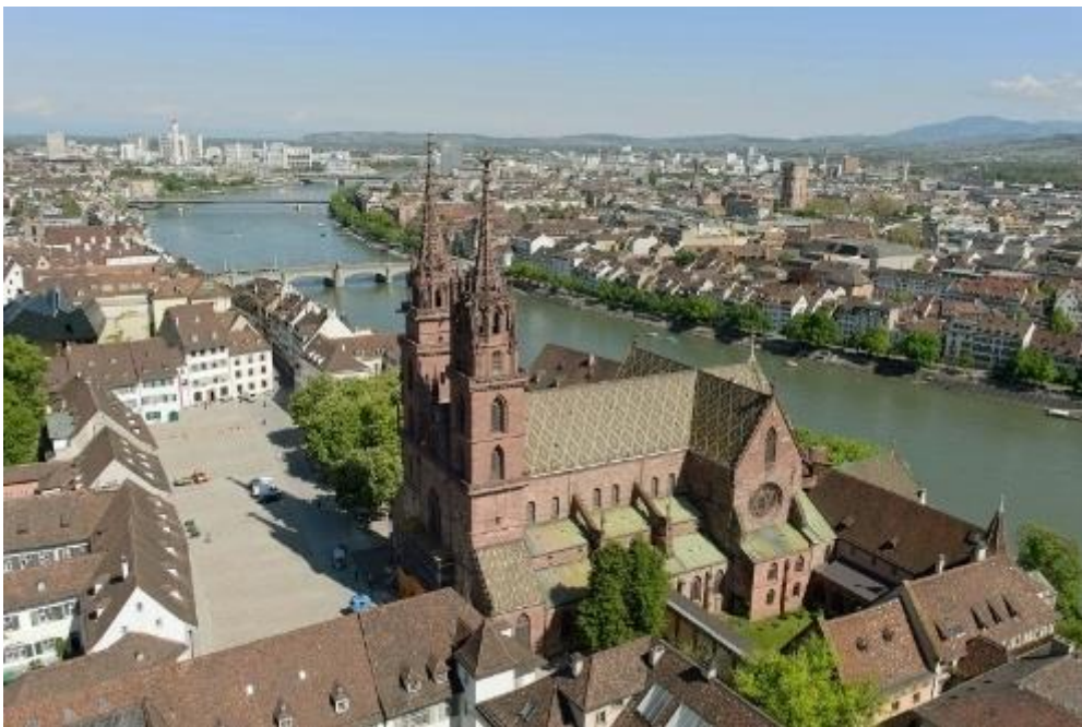
Das Münster ist eines der Wahrzeichen der Stadt Basel.

Basel liegt im Dreiländereck, wo die Schweiz, Frankreich und Deutschland aufeinandertreffen. Grenzüberschreitende Kontakte gehören hier deshalb seit jeher zur Tagesordnung. In vielen Fragen rund um Verkehr, Umwelt, Bildung und Kultur arbeitet Basel eng mit seinen Nachbarn jenseits und diesseits der Grenzen zusammen. Dieser besonderen Lage mitten im Dreiländereck Deutschland-Frankreich-Schweiz verdankt die Stadt ihre Weltoffenheit, ihre wirtschaftliche Potenz und ihre kulturelle Vielfalt.